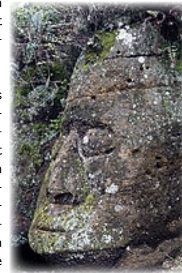
Figur - Florena

Der erste bekannte Siedler dieser Insel war ein zurückgelassener Pirat, der so nach und nach verschiedene Früchte angebaut hat und diese dann bei vorbeifahrenden Schiffen immer gegen Rum eingetauscht hat.