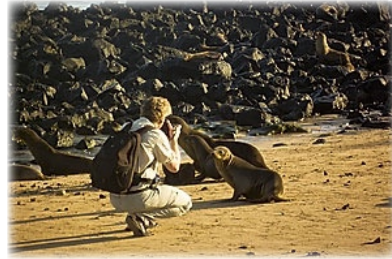
Seelöwen - San Christobal

sie interessiert und auf sie zuwatschelt. Bringt es eigentlich Glück, wenn man in Seelöwenscheisse tritt?