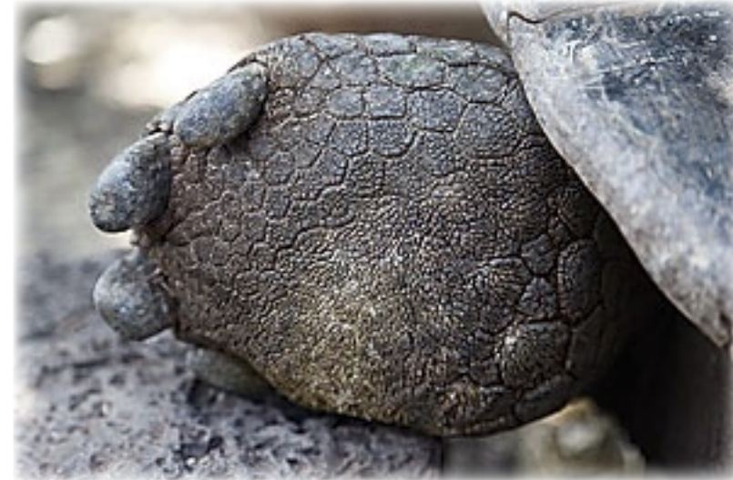
Riesenschildkröte - Santa Cruz