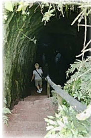
Lava Tunnel - Santa Cruz

Letzter Teil des Ausfluges ist dann ein Platz, von wo aus man auf einem Pfad zu einer Frischwasserlagune (El Chato) laufen kann und wo es auch frei lebende Riesenschildkröten gibt. Unsere älteren