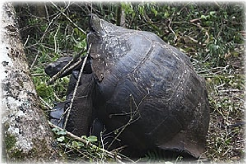
Riesenschildkröte - Santa Cruz

schön abenteuerlich und überhaupt nicht für Touristen hergerichtet. Vom Urwald her das Schönste seit Borneo.