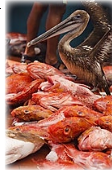
Fischmarkt Puerto Ayora - Santa Cruz

Irgendwann laufen wir zurück zum Hotel, wo es Mittagessen im Kantinenstil gibt. Hat dann aber besser geschmeckt als es ausgesehen hat. Auch hier ist es ziemlich heiß und wir sind nass geschwitzt. Daher duschen wir auch