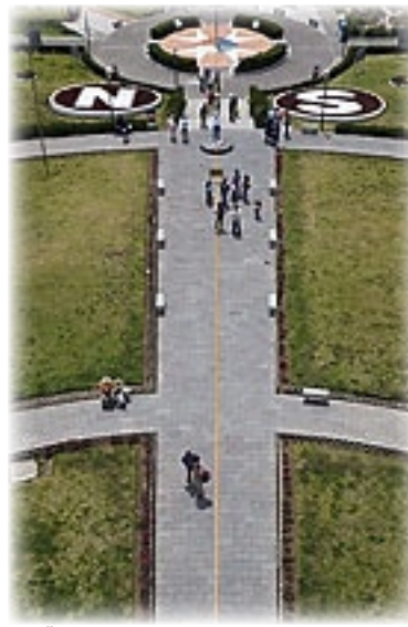
Äquator-Denkmal - San Antonio

Dann kommt noch mal kurz Stress auf. Unsere Gruppe weiß dank Email, dass wir später kommen und so ist das Tagesprogramm um eine halbe Stunde nach hinten verschoben worden. Wir haben gerade mal Zeit schnell zu duschen, frische Unterwäsche zu schnappen (welche Wonne) und los geht's zum Äquatordenkmal.