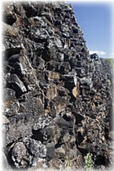
Wall of Tears - Isabella

Auf dem Weg dorthin kann man viele wilde Schildkröten sehen, ob-