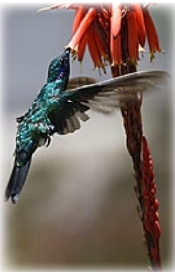
Colibri - San Antonio

So genießen wir den dramatischen Himmel und gehen nach nebenan zu einem kurzen Shopping-Ausflug im alten Bischofspalast. Kitschliebhabern wird er sicher gefallen. Es gibt nämlich nicht den sonst überall verbreiteten asiatischen Kitsch, nein, hier gibt es südamerikanischen Kitsch und den vom feinsten.