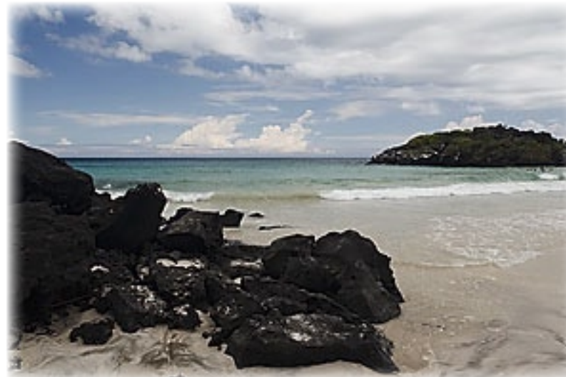
Puerto Chino - San Christobal

Zurück zum Restaurant lassen wir es uns gut gehen. Es gibt Saft, Hühnchen, Wurst, Reis und Gemüse Auch für unsere Vegetarier wird gut gesorgt. Den Nachmittag verbringen wir dann an dem wunderschönen weißen Chino-Strand mit hohen Wellen türkisfarbenen