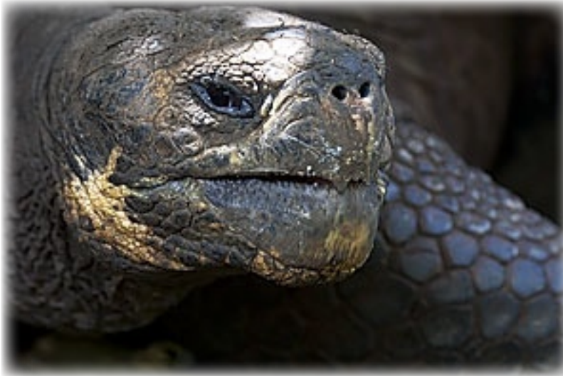
Riesenschildkröte - San Christobal

Oben angekommen fliegen wieder die Fregattvögel über den 6m tiefen Vulkansee. Früher hätten sie hier gebadet, erklärt der einheimische Guide, aber heute dürfen sie das nicht mehr. Und die Fische, die sie zum Angeln und zur Freude der Vögel ausgesetzt