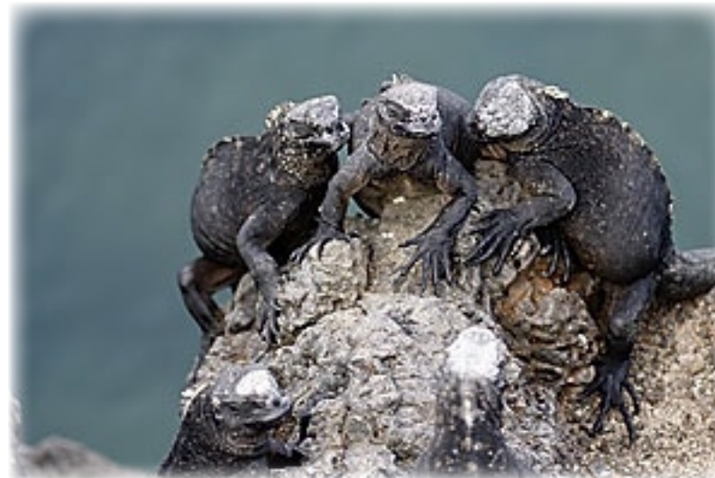
Meerechsen - Isabella

pergröße artet das Ganze zu einer gymnastischen Übung aus und Jürgen schlägt sich mindestens dreimal den Kopf an.