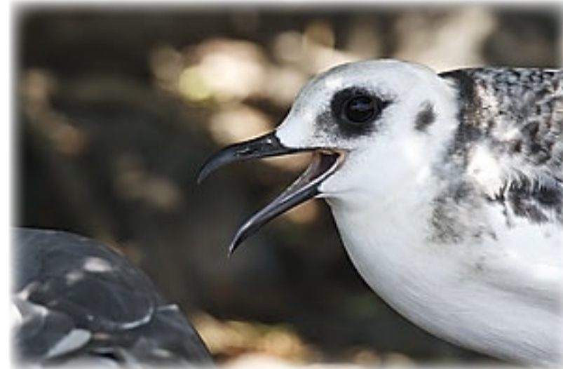
Gabelschwanzmöwe - Plaza Sur

ten Orten überall diese Landechsen. Ein Maskentölpel, wieder andere Seevögel, mit jedem Schritt, unter jedem der Kakusbäume ist etwas zu entdecken.