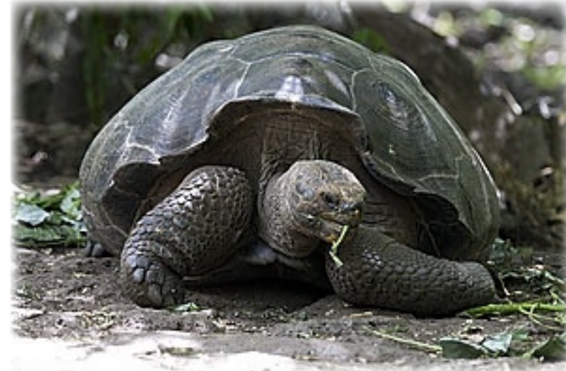
Riesenschildkröte - San Christobal

vorbeilaufen zu wollen. Unser Guide imitiert die Laute der Schildkröten, die diese beim Sex machen (der