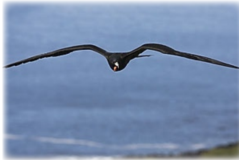
Fregattvogel - San Christobal

Jetzt sollen wir erst einmal direkt zu einem gemeinsamen Mittagessen kommen. Hier hat man wohl schon auf uns gewartet: Es gibt Guavensaft in Kannen, Popkorn, Kartoffelsuppe und Fisch. Außerdem noch Schokoladenkuchen mit Soße. Anschließend zieht es uns erst einmal unter die Dusche. Hier kommt man sich vor wie im Brutofen. Aber danach sind wir nicht zu halten und laufen zur Promenade.