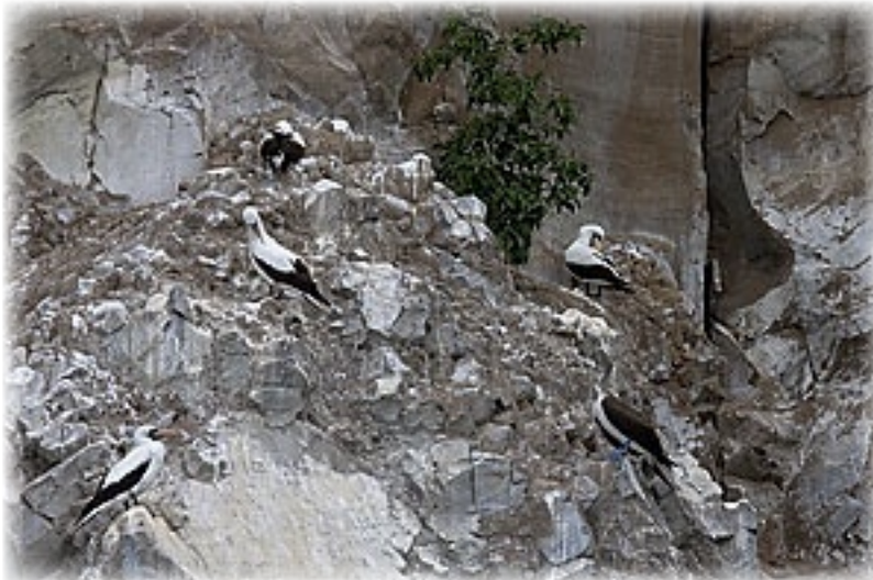
Blaufuss- und Maskentöpel - San Christobal