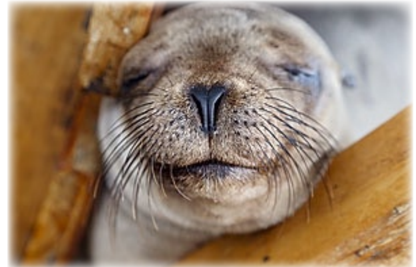
Seelöwe - San Christobal