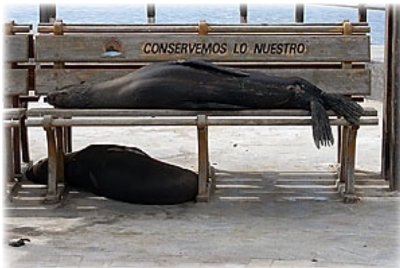
Seelöwen - San Christobal

Der Weg führt zunächst zu einem Besuchercenter und dann entweder zum Strand oder zu dem Fregattfelsen. Er ist richtig schön angelegt und besteht aus unregelmäßig geformten Steinen. Das letzte Stück ist dann eine Holzterrasse. Nicht wirklich fordernd aber bei diesen Temperaturen mehr als schweißtreibend. Aber dann der Blick: Wir sehen das Meer und weit unter uns einen kleinen, weißen Strand. Dann schauen wir in den Himmel und beobachten die uns umkreisenden, schwarzen Fregattvögel. Zur anderen Richtung blicken wir auf den Hafen, mit den vielen Schiffen. Ja, es ist schön hier. Den Rückweg schaffen wir dann just in time. Das Besucherzentrum das man