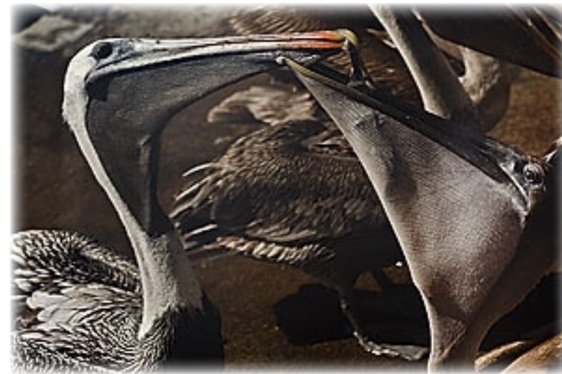
Fischmarkt Puerto Ayora - Santa Cruz

nicht gesprochen wird. Nirgends! Wir bekommen heraus, dass das Tourismusbüro an der Hauptstraße weiter vorne, rechts ist, finden es aber nicht.