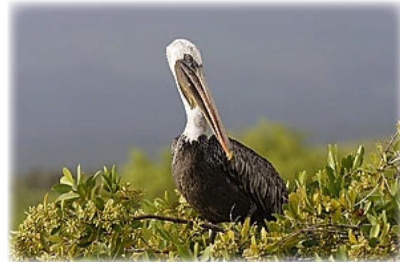
Pelikan - Santa Cruz