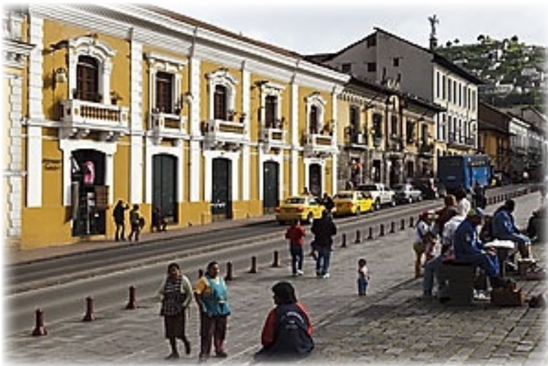
Plaza San Francisco - Quito

Lachende, alberne Nonnen im schwarzen Habit und an Henker oder Ku Klux Clan erinnernde Büßer in seltsamer Kleidung. Zum Schießen.