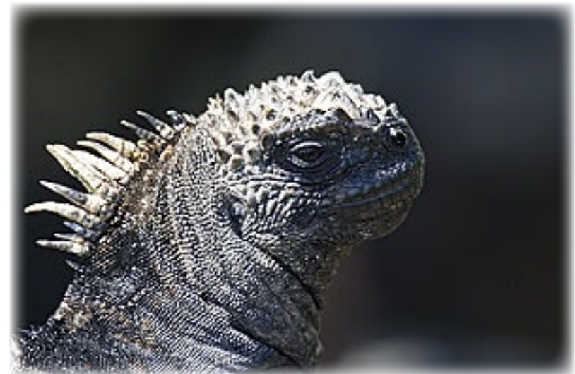
Meerechse - Isabella