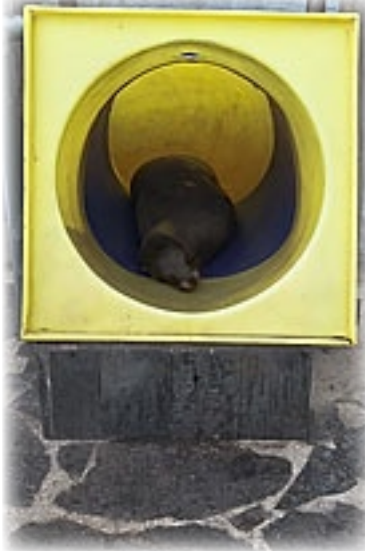
Seelöwe - San Christobal