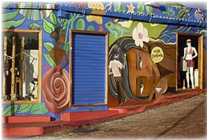
Puerto Ayora - Santa Cruz