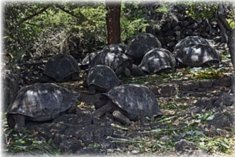
Riesenschildkröte - Santa Cruz