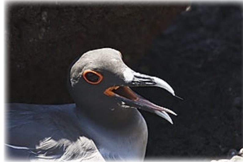
Gabelschwanzmöwe - Plaza Sur