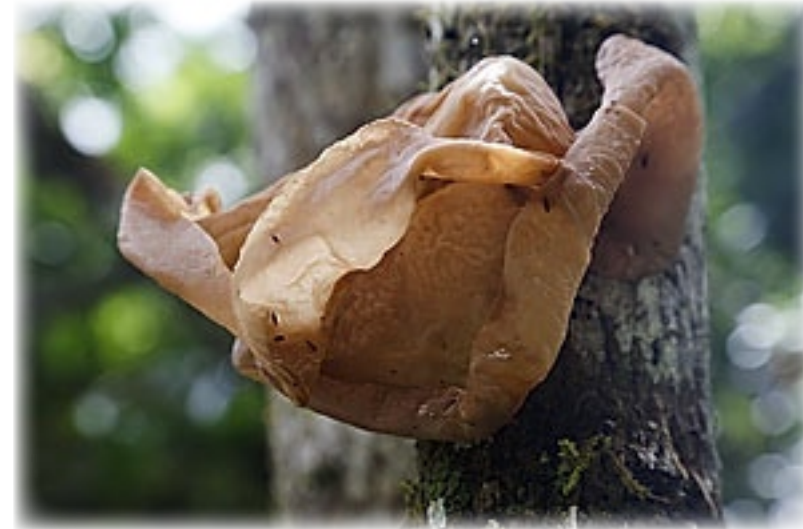
Baumpilz - Santa Cruz

Anschließend fährt uns der Bus zu einem Lavatunnel. Über Treppenstufen steigen wir in die Höhle, die erstaunlich geräumig und zumindest rudimentär ausgeleuchtet