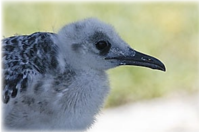
Gabelschwanzmöwe - Plaza Sur

milie unter einem Baum. Langsam gehen wir los. Da, ein Iguano, dann wieder Seelöwen und an den unterschiedlich-