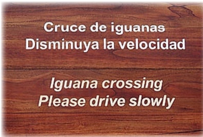
Iguana crossing - Isabella

wir machen noch einen Abstecher auf den Steg bei Iguana Crossing. Doch darauf hat das blöde Wetter nur gewartet: Nass bis auf die Haut erreichen wir das Hotel.