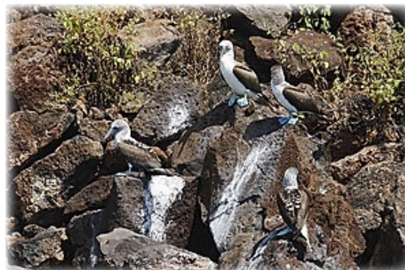
Blaufusstöpel - Santa Cruz

hat doch noch mal ins Wasser zu gehen, fliegen die Blaufüße wieder weg.