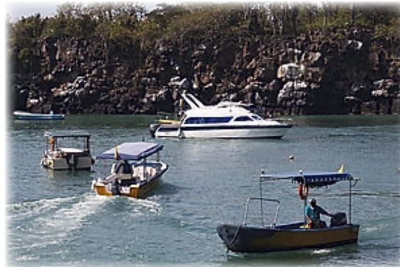
Puerto Ayora - Santa Cruz