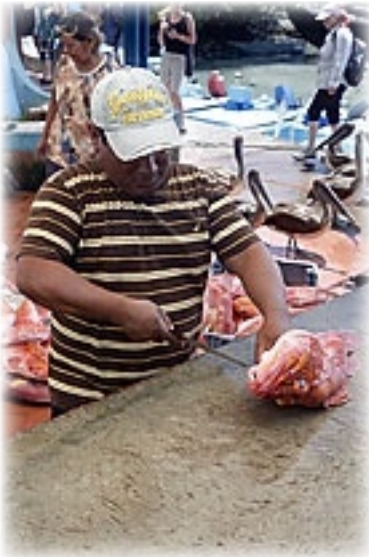
Fischmarkt Puerto Ayora - Santa Cruz

und meint, da werden wir sicher heute Abend zu abgefragt. Auch die kleinen Schildkrötchen, die nummeriert und in Kästen geschützt herumkrabbeln, rufen jetzt nicht unbedingt Begeigerungsschreie bei uns hervor. Okay, man kann verstehen, dass man hier stolz ist die Population der einzelnen Schildkrötenrassen zu erhöhen, aber bei der 2. Aufzuchtstation ist die gleiche Info wie zwei Tage zuvor zu erhalten ist eher langweilig.