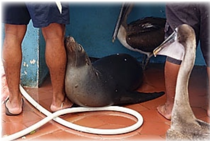
Fischmarkt Puerto Ayora - Santa Cruz

Interessanter ist, dass wir bei LG auf den neuesten Stand gebracht werden. Es folgt ein bisschen Klatsch und Tratsch aus dem Leben einer Riesenschildkröte: George hatte 17 Jahre lang zwei Schildkrötendamen im Gehege, aber keinen Sex mit ihnen. Hier kann man nur