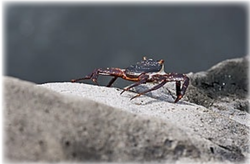
rote Klippenkrabbe - San Christobal

Im Hotel angekommen dann ein kurzes Duschen, Tagebuch schreiben und an den Pier. Hier gibt es wieder viel zu sehen: Wunderschöne Blüten an Kaktusbäumen, Seelöwen beim Nickerchen in Kinderrutschen, Kinder die zusammen mit jungen Seelöwen im Hafenbecken plantschen, schwarze und rote Krebse auf schwarzen Steinen und und und. Wir treffen andere aus unserer Gruppe, trennen uns und treffen uns wieder. Letztendlich sitzen wir dann alle zusammen in der kleinen Bar, wo es den tollen Saft gibt. Gar nicht zu verfehlen: Am Ende der Promenade und mit Kaffee und Cocktails im Angebot. Noch vor Einbruch der Dunkelheit gehen wir wieder in Richtung Hotel. Wir wollen noch für jeden von uns ein T-Shirt kau-