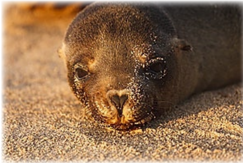
Seelöwe - San Christobal

ja durchqueren muss, macht – was wir nicht wussten – schon um 17:00 Uhr zu. Da wählt man also auf dem Rückweg besser den Abzweig in Richtung Strand. Von da geht es dann auch in den Ort.