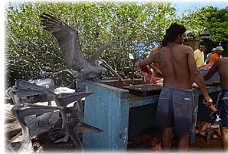
Fischmarkt Puerto Ayora - Santa Cruz

Es geht also erst durch die Stadt und dann auf einem befestigten Weg, treppauf an einem Torhäuschen vorbei und dann ziemlich lange auf einem Weg mit Mäuerchen auf beiden Seiten. Isabella hat einen ziemlich Zahn