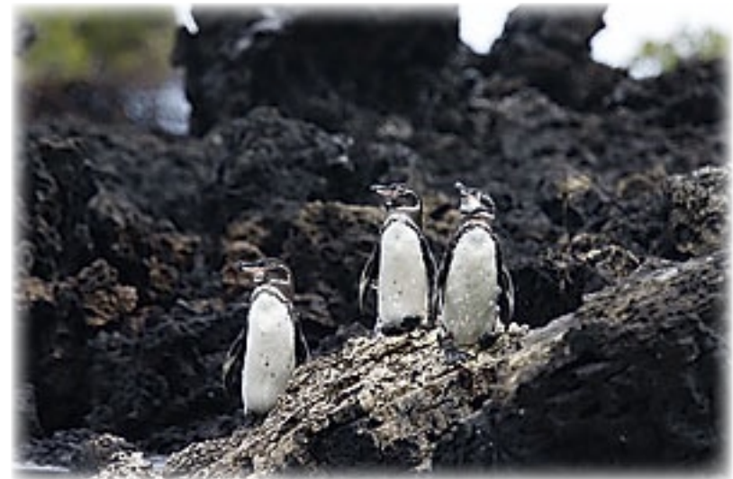
Pinguine - Isabella

Wir laufen also den bekannten Weg zurück und Freya holt sich sogar