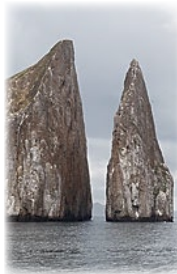
Kickers Rock - San Christobal

Mittlerweile regnet es sich ein und wer nicht inner-