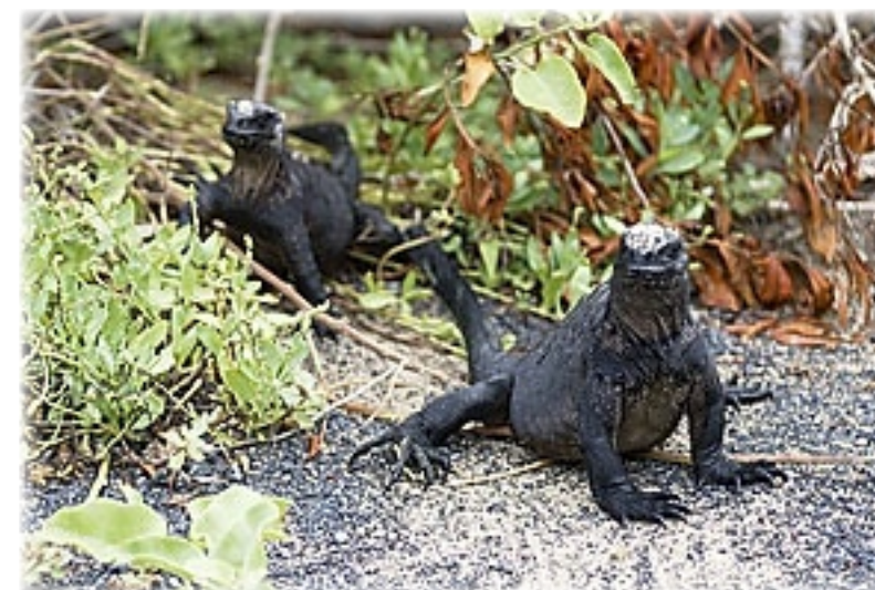
Iguana crossing - Isabella

Um 18:00 Uhr stellt sich der neue Guide vor und holt sich schon die ersten Minuspunkte, weil wir dadurch den schönen Sonnenuntergang verpassen. Außerdem macht