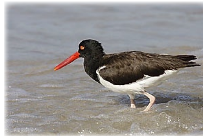
Austernfischer - Isabella

merken wir erst am Rückweg. Also laufen wir weiter, immer parallel zum Meer. Irgendwann geht es durch eine Art Tunnel