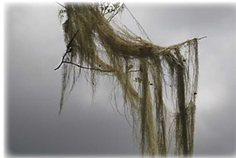
Farn - San Christobal

Wir frühstücken alle zusammen gegen 9:00 Uhr und fahren dann zu einem Kra-