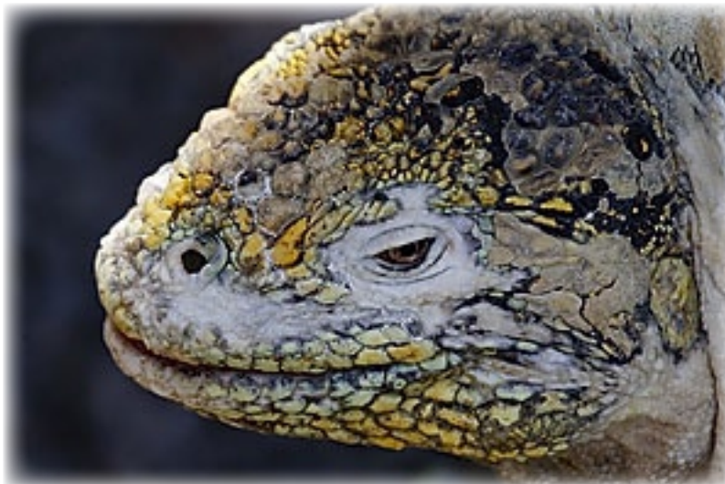
Landleguan - Plaza Sur