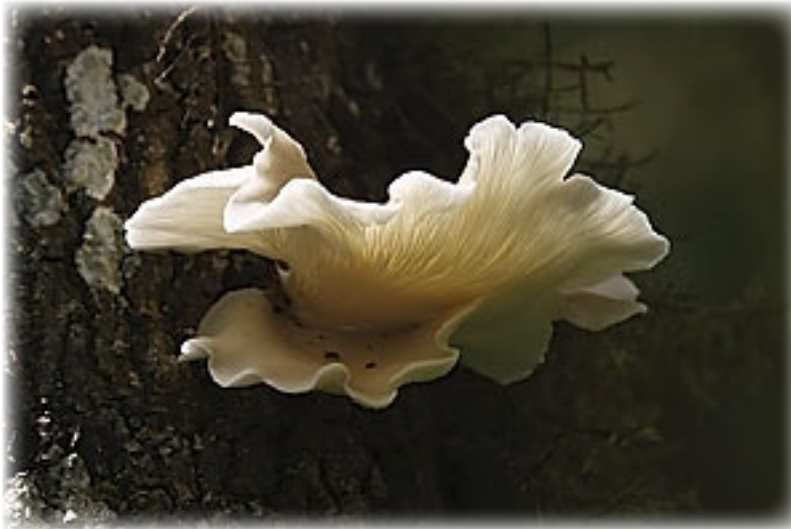
Baumpilz - Santa Cruz

Zuerst geht es zu zwei Kratern (Los Gemelos), die vermutlich aus einer Gasexplosion entstanden sind. Aber auch die Theorie von den Schmarotzervulkanen ist bei den Wissenschaftlern noch nicht völlig vom Tisch. Wir laufen auf einem Rundweg durch den Regenwald und werden dann von einer Art „Lotse“ über die Straße geleitet. Auch eine Art Beschäftigungsprogramm bei dem we-