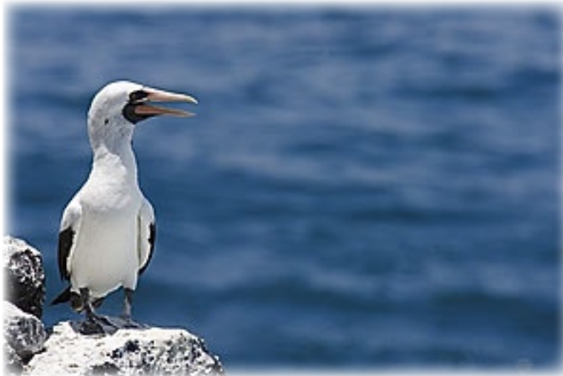
Maskentöpel Plaza Sur

Beim Schnorchelplatz angekommen sind viele von uns skeptisch. Das Wasser ist dunkel und trübe. Einige lassen das mit dem Schnorcheln sein und gehen einfach nur zum Schwimmen ins Wasser. Auch Freya macht das so, schwimmt eine Weile und geht dann wieder aufs Boot. Hätte sie nur ein bisschen länger gemacht. Plötzlich kommt ein ganzer Schwarm Fische jagender Boobies und setzt sich anschließend oberhalb der Schwimmer auf einen Felsen. Vom Boot aus wird wie wild fotografiert und gerade als Freya sich dazu durchgerungen