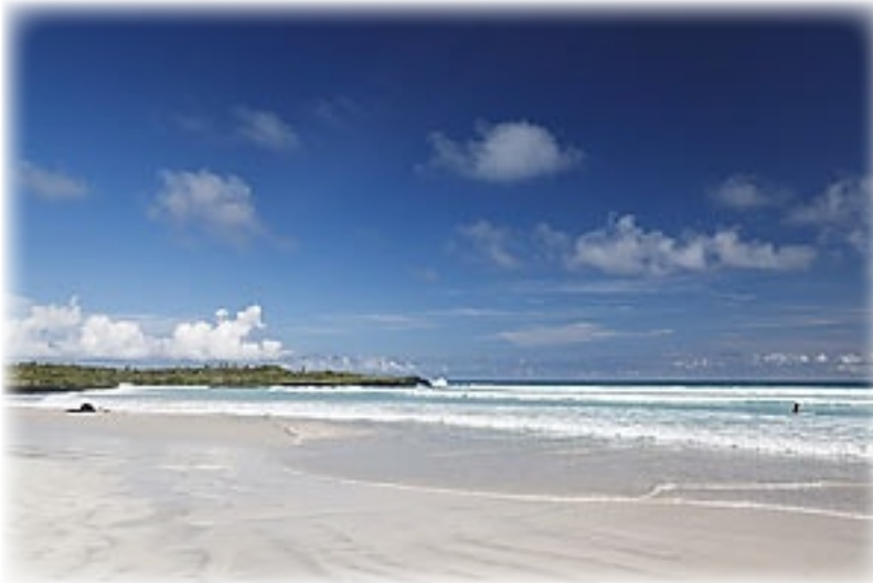
Tortuga Bay - Santa Cruz

Irgendwann sind wir dann alle am Strand dessen hohe Wellen aber nur zum Plantschen nicht jedoch zum Schwimmen einladen. Das Schild