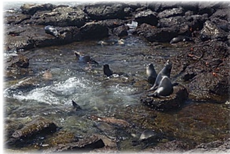
Seelöwen - Plaza Sur

Eigentlich könnte man hier schon stundenlang stehen bleiben. Hier ist die Seelöwenkinderstube und im Becken geht