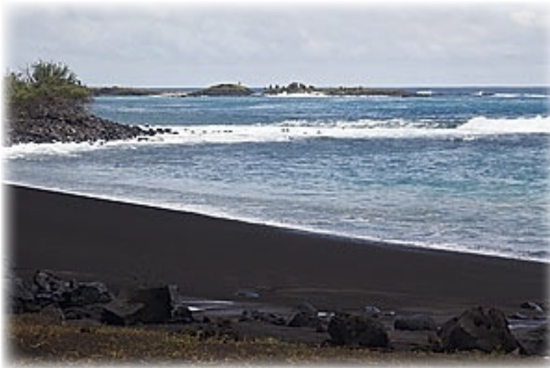
Strand Puerto Velasco Ibarra - Florena