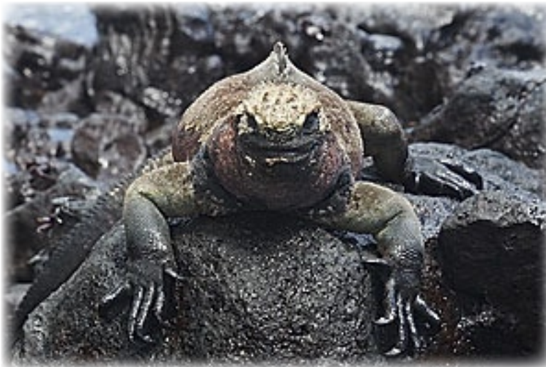
Meerechse - Florena

Zum Mittagessen gibt es guten Fisch, Linsen, Kartoffeln, Reis und Tomaten. Da kann man sich nicht beschweren. Dann haben wir Zeit für eine kleine Siesta und