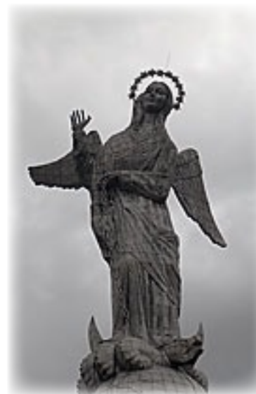
Virgen de Quito - Quito